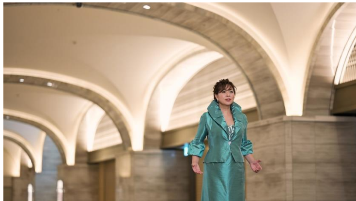
ドヴォルザーク《ルサルカ》より「月に寄せる歌」 映像イメージ