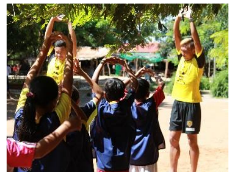
カンボジアでの寄贈の様子(2019 年 9 月)