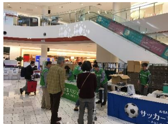
会場でのサッカー用品回収の様子