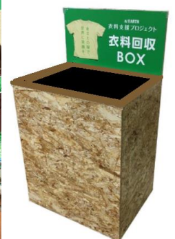
会場での衣料品回収の様子(2021年11月、12月)