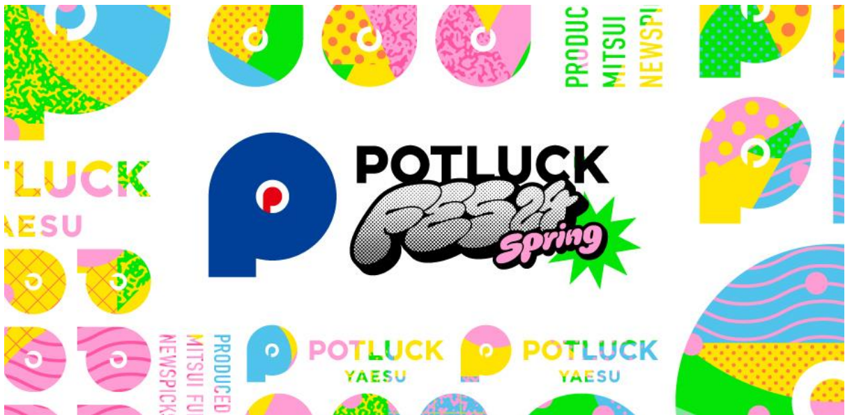
「POTLUCK FES'24 Spring」のキービジュアル

詳細は「POTLUCK FES'24 Spring」公式WEBサイト( https://fes.potluck-yaesu.com )よりご覧ください。