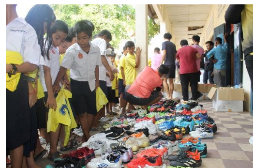
カンボジアでのサッカー用品寄贈の様子(2023 年 6 月)