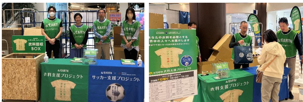
前回の衣料品回収風景(2023年10月)

・実績の詳細についてはJRCCのホームページ上( http://www.jrcc.or.jp/ )にてご確認いただけます。