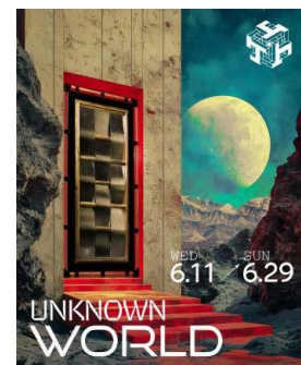
6月11日～6月29日 「Unknown World」

*このほかにもゲスト・出店者・アーティスト・コンテンツ多数追加予定。詳細は@we_are_sampo の Instagram にて随時公開します。