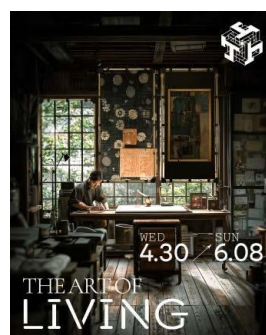
4月30日～6月8日 「The Art of Living」