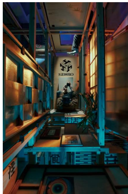
コミュニティ・ショーウィンドウ「表間」