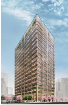
「日本橋本町三井ビルディング &forest」 外観イメージ