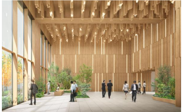
「日本橋本町三井ビルディング &forest」 エントランスホール完成予想イメージ