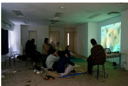
東京都中央区日本橋室町1-10-1