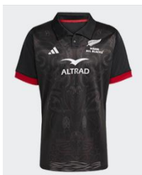
マオリ・オールブラックス サイン入りグッズ