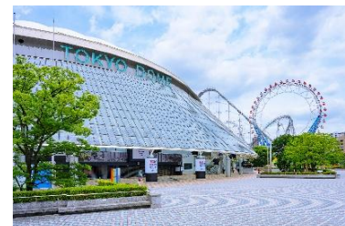
東京ドームシティ （東京都文京区）