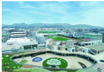
三井ショッピングパーク ららぽーと福岡