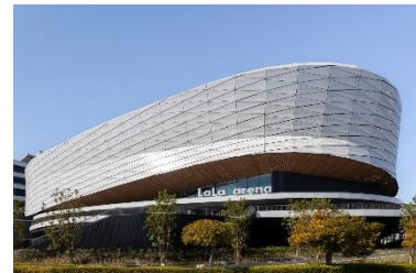
LaLa arena TOKYO-BAY （千葉県船橋市）