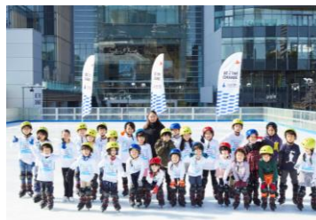
三井不動産スポーツアカデミー （アイススケートアカデミー）