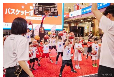
三井不動産スポーツアカデミー （バスケットボールアカデミー）