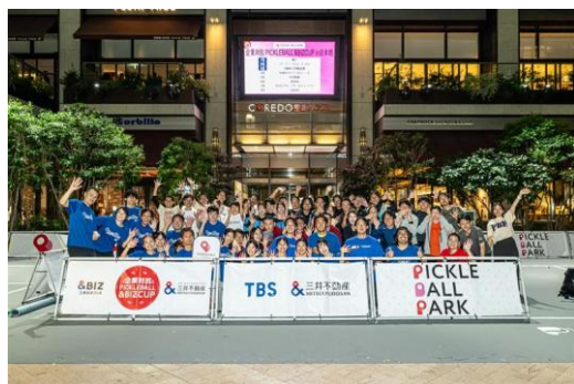
テナント企業向け参加型イベント「&BIZ event」 企業対抗ピクセルボール「&BIZ CUP」開催の様子

『&BIZ 三井のオフィス』では、&BIZを通じてワーカーの毎日をより豊かにし、テナント企業のパフォーマンスの最大化につながるサービス提供に取り組んでいます。