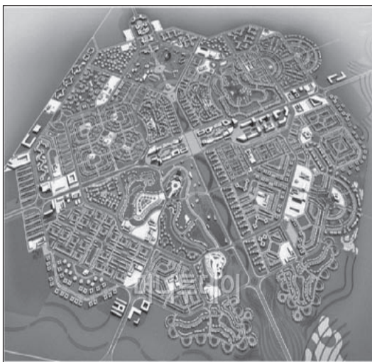
図表4 アルジェリアのハシメサウド新都市開発

受注型は、入札及び指名により、外国政府等が行う都市開発事業を受注する事業としてLH公社と民間企業(建設企業・エンジニアリング企業等)との共同で受注するケースである。受注型の事例としては、アルジェリアのハシメサウド新都市開発と都市計画調査設計があげられる。アルジェリアのハシメサウド新都市造成事業は、サハラ砂漠の油田採掘地の地盤沈下による既存都市(人口6万人)を代替都市づくりとして新都市(総人口8万)は物流産業団地を総面積4,483haに開発する事業である。総事業は60億ドルに達する超大型プロジェクトで新都市造成工事費だけでも16億ドルに達する(図表4)。