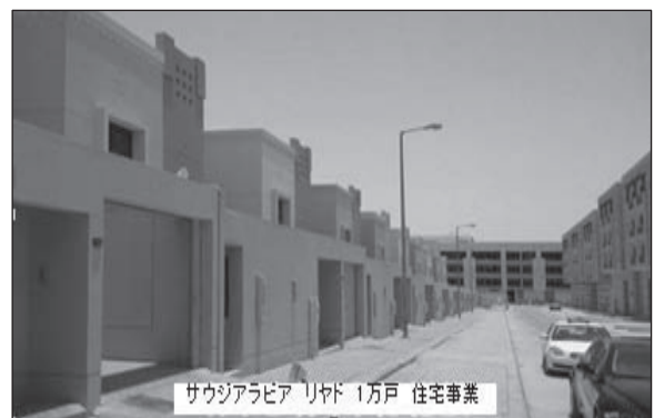
図表5 サウジアラビア リヤドの住宅開発事業

協力型は、ODAとは別に国家間の経済協力事業として、LH公社が政府(国土海洋部)の支援により民間企業(建設会社等)と協力しコンソーシアムを形成して取り組む事業である。事例としてサウジアラビア首都のリヤド近隣の503ha面積に、住宅1万戸規模の住宅事業設計・施工の一括受注事業を進行中である(図表5)。