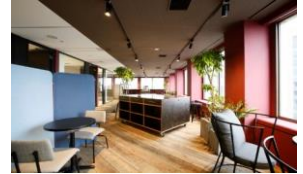
ワークスタイリング霞が関