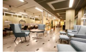
ワークスタイリング新宿西口