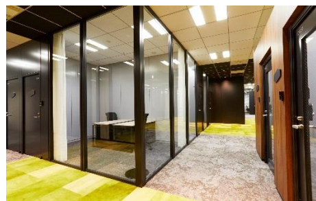
ワークスタイリング八重洲 FLEX