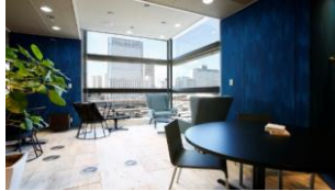
ワークスタイリング品川

ワークスタイリング オフィシャルサイト： https://mf.workstyling.jp