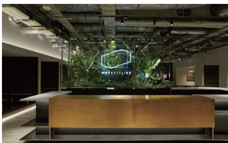
ワークスタイリング八重洲（受付）