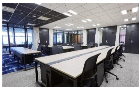
ワークスタイリング東京ミッドタウン FLEX