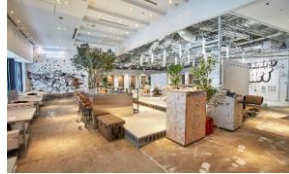
ワークスタイリング汐留