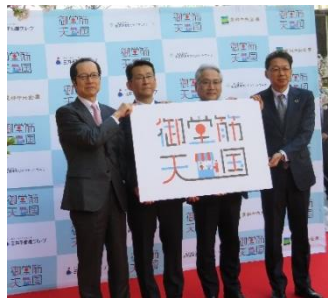
プロジェクト発表会の様子